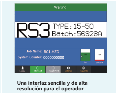
Una interfaz sencilla y de alta resolución para el operador