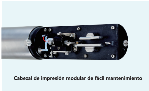
Cabezal de impresión modular de fácil mantenimiento