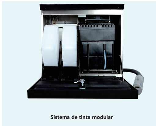
Sistema de tinta modular