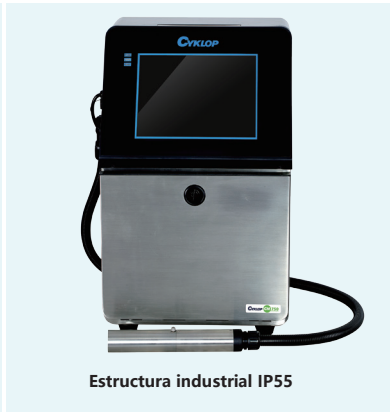
Estructura industrial IP55