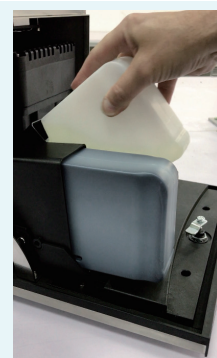
Adición de fluidos rápida y limpia.