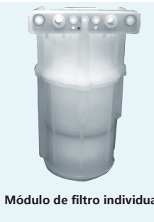
Módulo de filtro individual