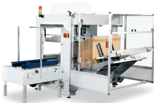
CT 3000 con precintadora inferior CT 302 SD