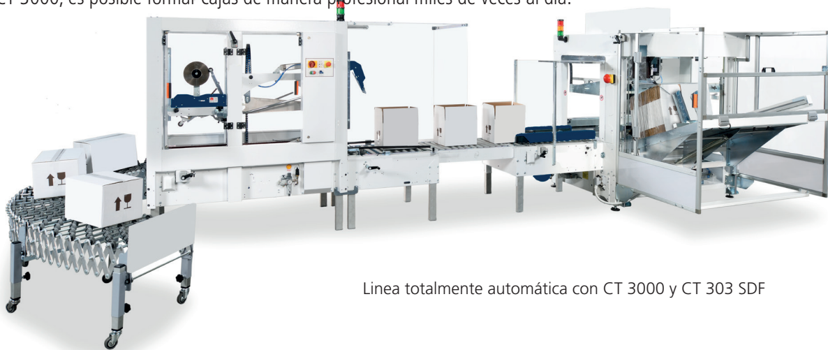
Línea totalmente automática con CT 3000 y CT 303 SDF

Con la CT 3000, es posible formar cajas de manera profesional miles de veces al día.